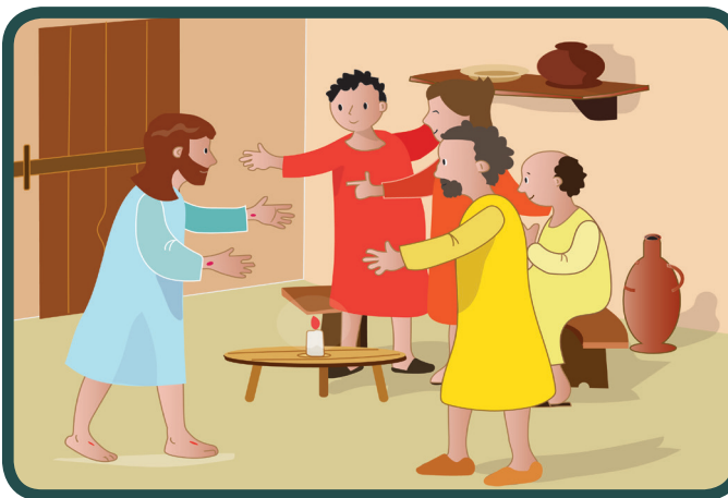
Navečer im se ukazao Isus sa znakovima muke na tijelu. Pozdravio ih je riječima: „Mir vama!“ Učenicima se tada vratila radost.