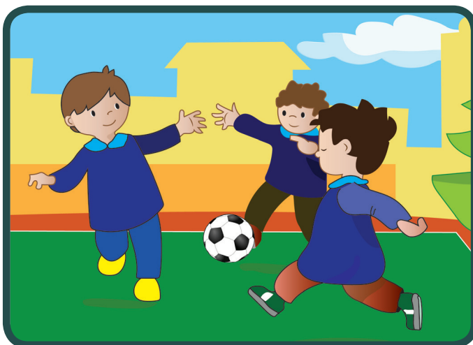
Luka iz Sjedinjenih Američkih Država pripovijeda: Za vrijeme velikog odmora u školi smo se igrali s loptom.