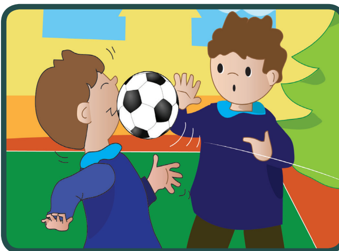
Jednoga mojega prijatelja lopta je jako udarila.