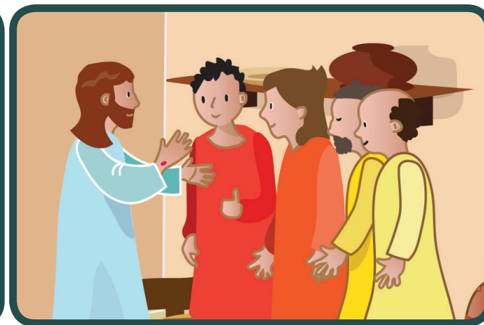
Potom im je povjerio zadatak da u svijet nose novost evanđelja. Prije nego što je otišao dahnuo je u njih i rekao: „Primite Duha Svetoga“. (Iv 20,22)