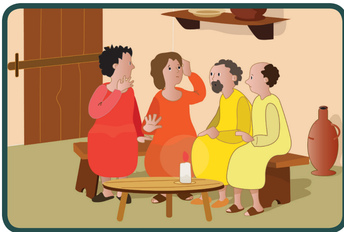
Nakon Isusove smrti učenici su bili prestrašeni

„Mir vama! Kao što mene posla Otac i ja šaljem vas.“ (Iv 20,21)